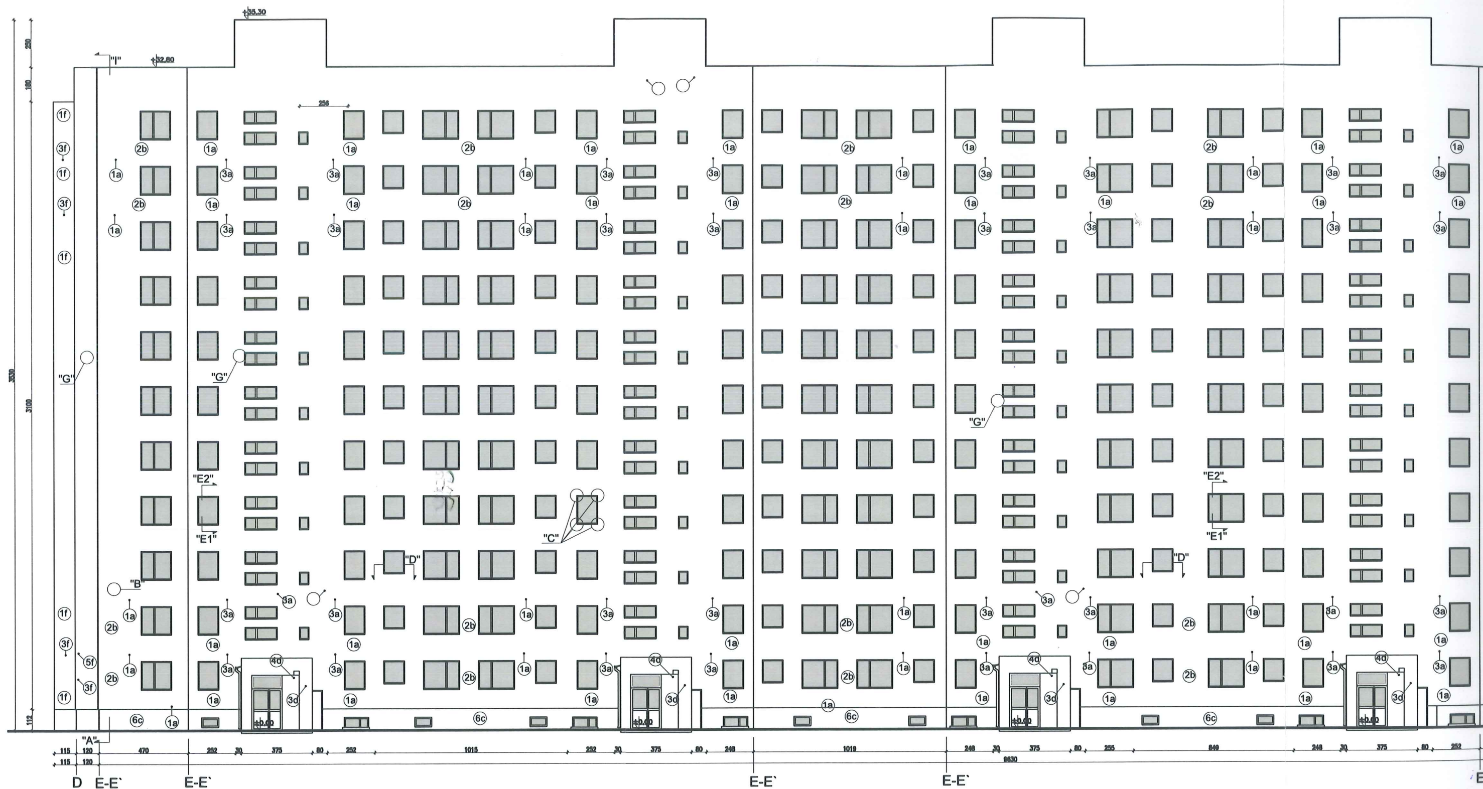
Detal bonii "G" skala 1:25